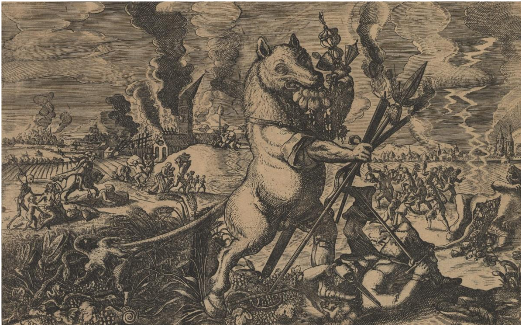
Abbildung des unbarmhertigen, abscheulichen, grausam- und gewulichen Thiers ( http://digital.slub-dresden.de/id334171156 )

Bedrohlich ruht ein echsenartiges Monstrum auf den Ruinen einer zerstörten und geplünderten Stadt. Dampf dringt aus seinen Nüstern und die linke der gepanzerten Vorderpranken liegt auf einer scheinbar leblosen Frau, einem erdolchten Mann und getötetem Nutzvieh. Neben der schrecklichen Szene lässt sich ein Söldner erkennen, der durch seine hochgezogenen Schultern und nach oben weisenden Handflächen sichtlich unschlüssig, vielleicht auch unbeeindruckt wirkt. Die Szene stammt aus einem wahrscheinlich in der Mitte des Dreißigjährigen Krieges entstandenen Flugblatt und stellt den Konflikt als unzählbare, tierische Bestie dar, die brutale Gewalt gegenüber unschuldigen Zivilisten übt. 1