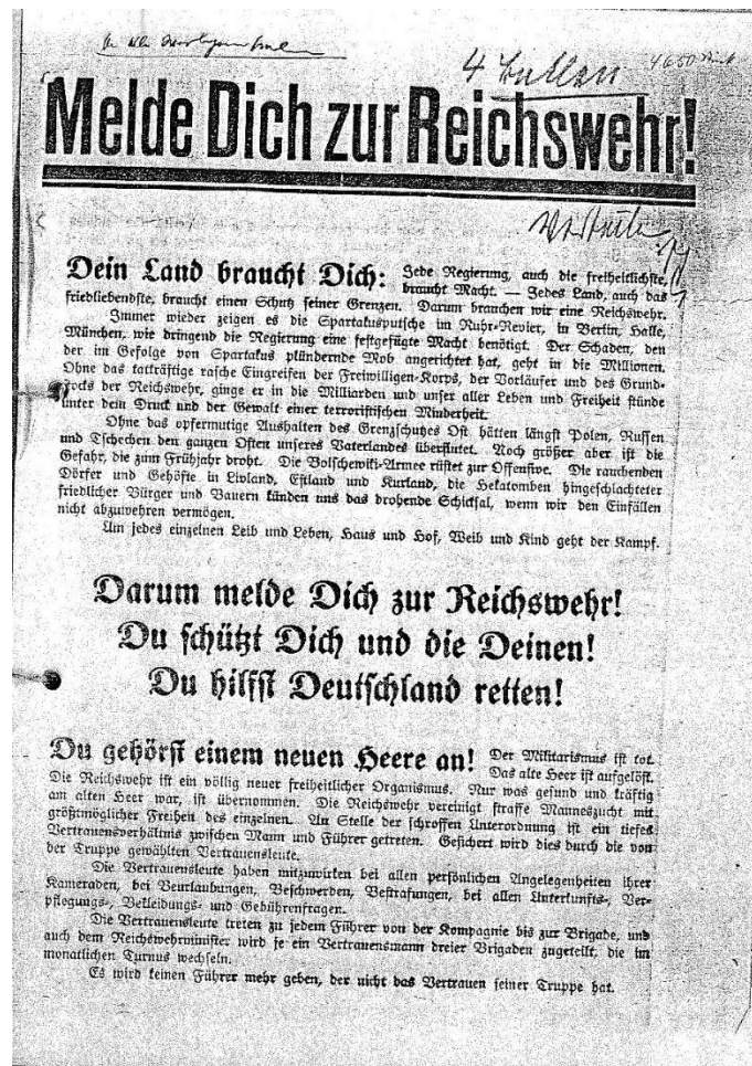
Abbildung 3: Werbeplakat der Reichswehr, 1919

In der Frage der Reichsfarben agierte Reinhardt ebenfalls konzilianter als so mancher seiner Standesgenossen. Er erkannte an, dass die Nationalversammlung sich für die Farben schwarz-rot-gold entschieden hatte und die Reichswehr nicht mehr die traditionsreiche schwarz-weiß-rote Kokarde führen konnte. Um den Wünschen der Republik entgegenzukommen, ohne die vielen Traditionalisten in der Armee zu verprellen, die unter keinen Umständen eine schwarz-rot-goldene Kokarde tragen wollten, setzte er die Einführung der sogenannten Adlerkokarde durch, die einen schwarzen, rotbewehrten Adler auf goldenem Grund zeigte. 22 Wie wenig selbstverständlich diese Haltung war, zeigte sich daran, dass die Adlerkokarde unmittelbar nach der Machtübernahme der Nationalsozialisten umgehend durch eine schwarz-weiß-rote Kokarde ersetzt wurde. 23