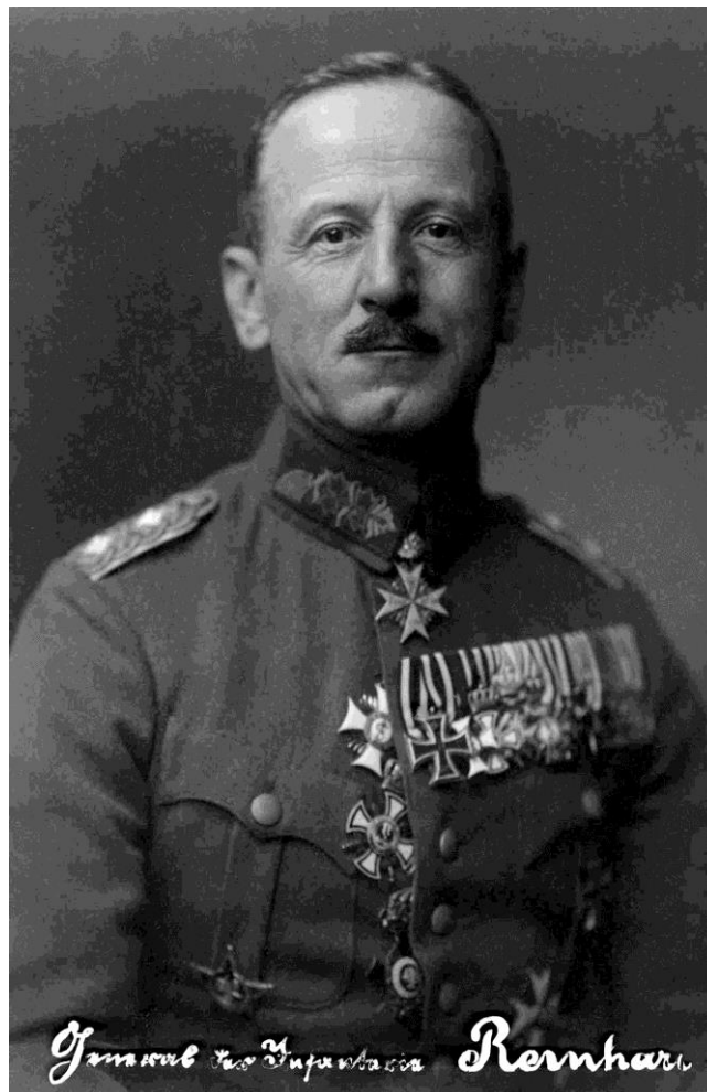
Abbildung 1: General Walther Reinhardt (1872–1930)

Zusammenfassung: Die Reichswehr hat in der populären Meinung nicht den besten Ruf. Landläufig gilt sie bis heute als „Staat im Staate“. Tatsächlich gibt es viele Befunde, die dieses Urteil in der ein oder anderen Weise stützen. Aber war es der Reichswehr wirklich von vorneherein in die Wiege gelegt, ein Fremdkörper in der Weimarer Republik zu bleiben?