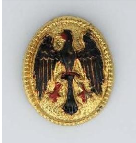
Abbildung 4: Adlerkokarde der Reichswehr (Museum Berlin-Karlshorst Inv.-Nr. 208257)