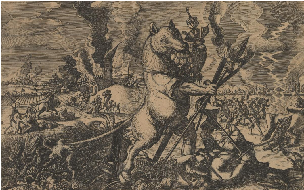
Abbildung des unbarmhertigen, abscheulichen, grausam- und gewrelichen Thiers ( http://digital.slub-dresden.de/id334171156 )

Bedrohlich ruht ein echsenartiges Monstrum auf den Ruinen einer zerstörten und geplünderten Stadt. Dampf dringt aus seinen Nüstern und die linke der gepanzerten Vorderpranken liegt auf einer scheinbar leblosen Frau, einem erdolchten Mann und getötetem Nutzvieh. Neben der schrecklichen Szene lässt sich ein Söldner erkennen, der durch seine hochgezogenen Schultern und nach oben weisenden Handflächen sichtlich unschlüssig, vielleicht auch unbeeindruckt wirkt. Die Szene stammt aus einem wahrscheinlich in der Mitte des Dreißigjährigen Krieges entstandenen Flugblatt und stellt den Konflikt als unzählbare, tierische Bestie dar, die brutale Gewalt gegenüber unschuldigen Zivilisten übt. 1